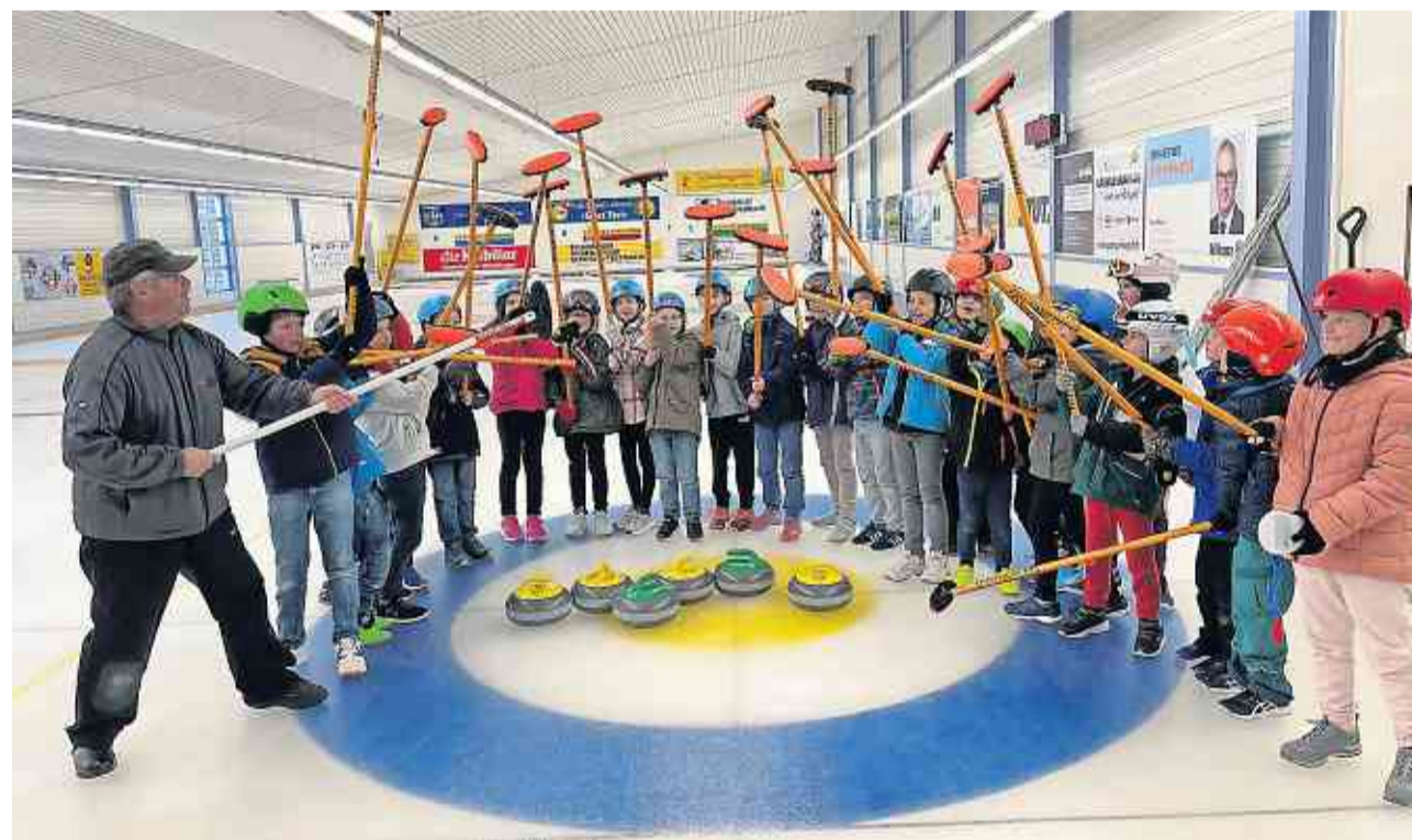
Die Unterstufe Hugelshofen bei ihrem Besuch in der Curlinghalle Weinfelden.