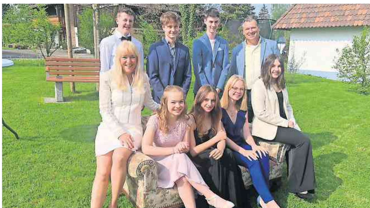
Die Konfirmandinnen und Konfirmanden

„Lebe aussergewöhnlich“ – mit diesem Motto und Predigthema schickte Pfarrer Ditthardt die Jugendlichen auf ihre Reise mit Gott: 1. Take a risk – setzte alles auf eine Karte, auf ein Leben mit Gott! 2. Think big – trau deinem grossen Gott Grosses zu – mit Gott ist alles möglich! 3. Jesus kam, um zu dienen: Diene anderen, sei für andere da! Mit Rose, Urkunde und selbst ge-