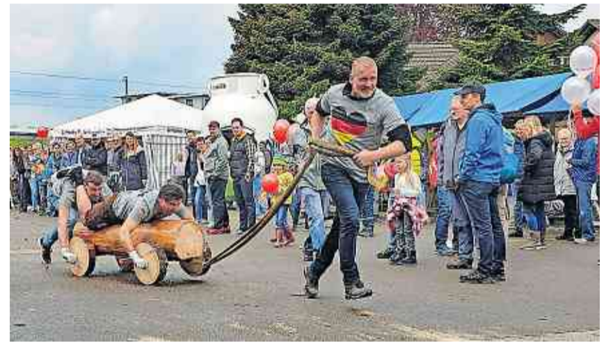
Hauptattraktion waren die «Team-Wettbewerbe».

Im zweiten Wettbewerb «Kehrwoche» musste ein Teammitglied mit einer Kehrriechschaukel «Wasserbomben», mit Wasser gefüllte Ballone, über eine etwa zwei Meter hohe undurchsichtige Wand werfen, auf deren Gegenseite zwei andere Teammitglieder versuchten, diese «Wasserbomben» mit Eimern aufzufangen. Sieger wurde knapp vor jenem aus Mengen das Team «Behörden».