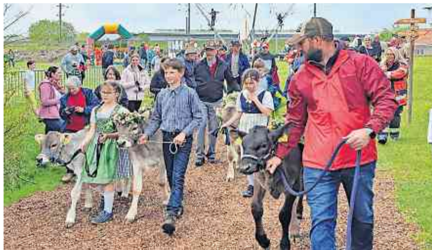
Kinder präsentierten stolz ihre kranzgeschmückten Kälber.

film-Theater umgestaltet worden war und in der man die isolierten Kälblein in einer in den Vortagen aufgenommen Videoaufnahme zusammen mit dem präsentierenden Kind «live» ansehen konnte. Im gleichen «Kino-Raum» wurde anschliessend ein Erinnerungsfilm an die Jubiläumsviehschau 1987 in Siegershausen gezeigt.