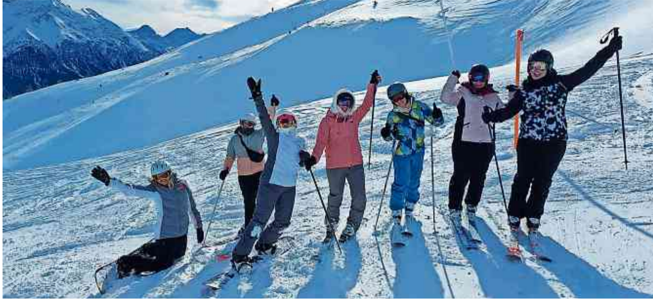
Auf Turnfahrt in der Lenzerheide.