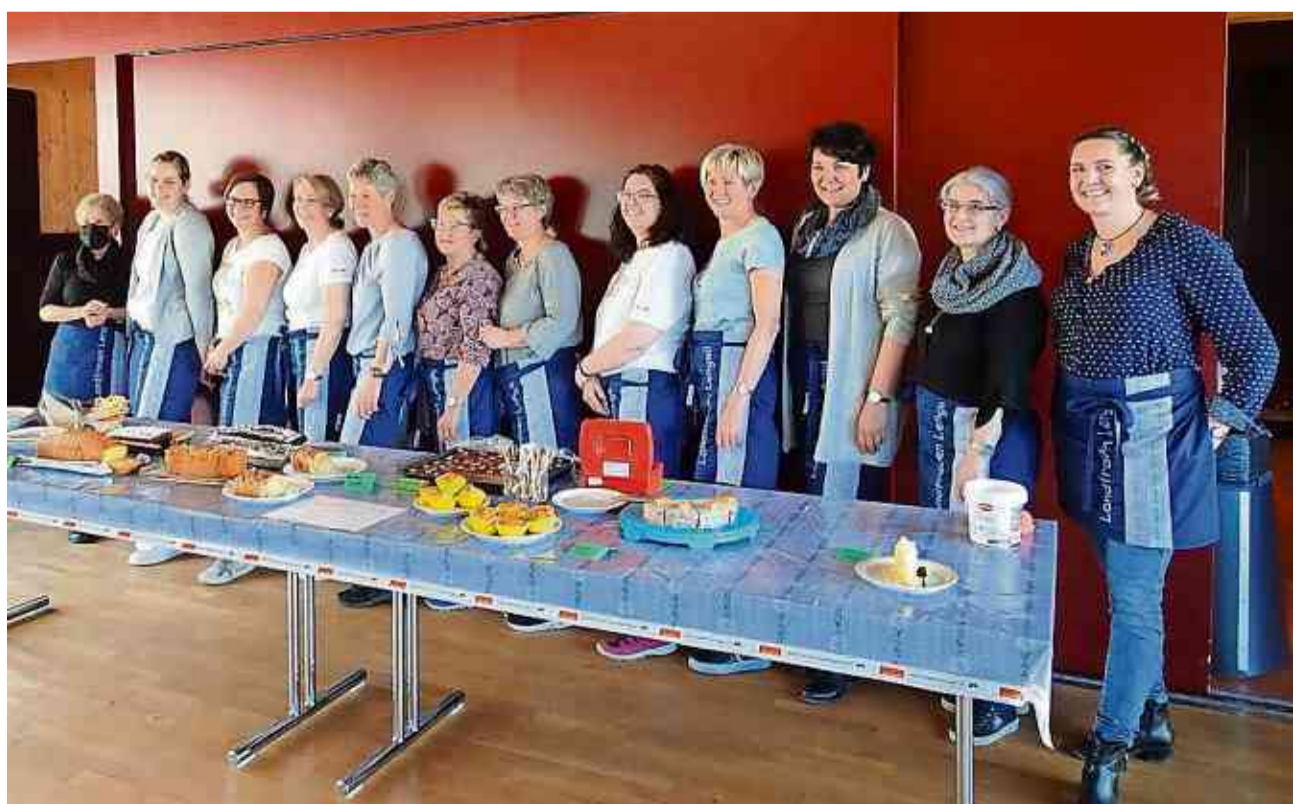
Die Kuchen werden von den Landfrauen gespendet.

Zu diesem geselligen Anlass ist jedermann herzlich eingeladen!