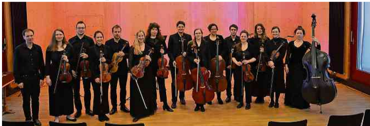
Die Camerata Aperta gab ein Konzert in Illighausen.

Zu Beginn erhielt das zahlreich erschienene Publikum im farbig und stimmungsvoll beleuchteten Saal einen kurzen Ausblick auf das Programm mit sehr gegensätzlichen Werken. Das Thema des Abends hiess «Art destroys silence», sinngemäss: «Die Kunst vermag das (unheilvolle) Schweigen zu durchbrechen». Ein Spiegel unserer krisenhaften Zeit voller Schatten, doch lebt in uns die Hoffnung auf das Licht nach der Dunkelheit. Auf diesen wechselvollen und sehnsuchtsvollen Weg nahm das Orchester sein Pu-