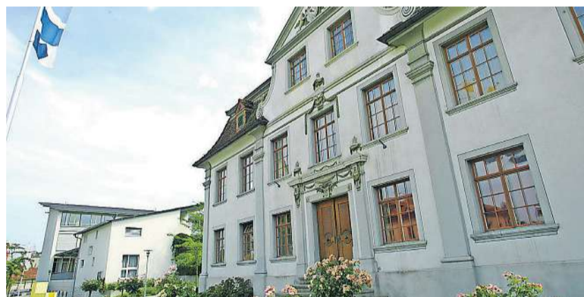
Die Sonderausstellung findet im Museum Rosenegg statt.

Am grossen Stadtfest vom 1. Juli bis 3. Juli 2022 feiert Kreuzlingen sich selbst; die Vorbereitungen dafür laufen auf Hochtouren. Was in diesen 75 Jahren in Kreuzlingen alles geschah und wie die Bevölkerung ihre Stadt gesellschaftlich, kulturell, sportlich, wirtschaftlich und politisch belebt und entwickelte wird in einer Sonderausstellung im Museum Rosenegg zu sehen sein. Im Mittelpunkt stehen die Menschen und ihre erlebten "Stadtgeschichten", die auch mit persönlichen Fotos bereichert werden sollen. Je nach Bildmotiv werden die Bilder, die zwischen 1947 bis heute entstanden sind, themenbezogen prä-