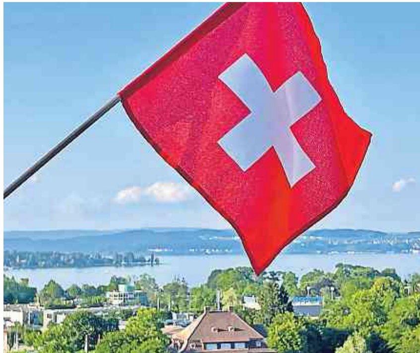
Die 1.-August-Feier wird in diesem Jahr vom Quartierverein Kurzrickenbach organisiert.

Es wird eine Zu- und Wegfahrt mit den Kreuzlinger Stadtbussen empfohlen. Der Nachtbusbetrieb wird über die Haltestelle Käsbach geführt und fährt bis Mitternacht. Das Programm finden Sie in der Infobox auf der rechten Seite. IDSK