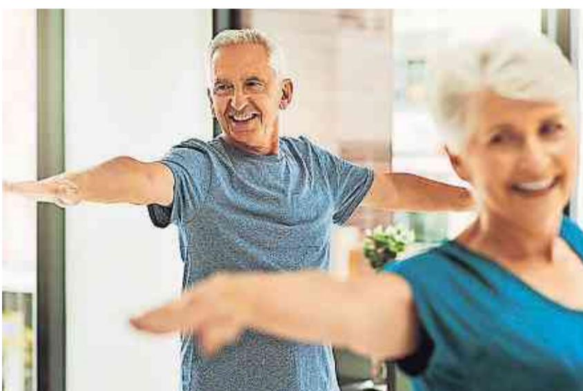
Wer sich regelmässig bewegt und trainiert, kann länger selbstständig bleiben.