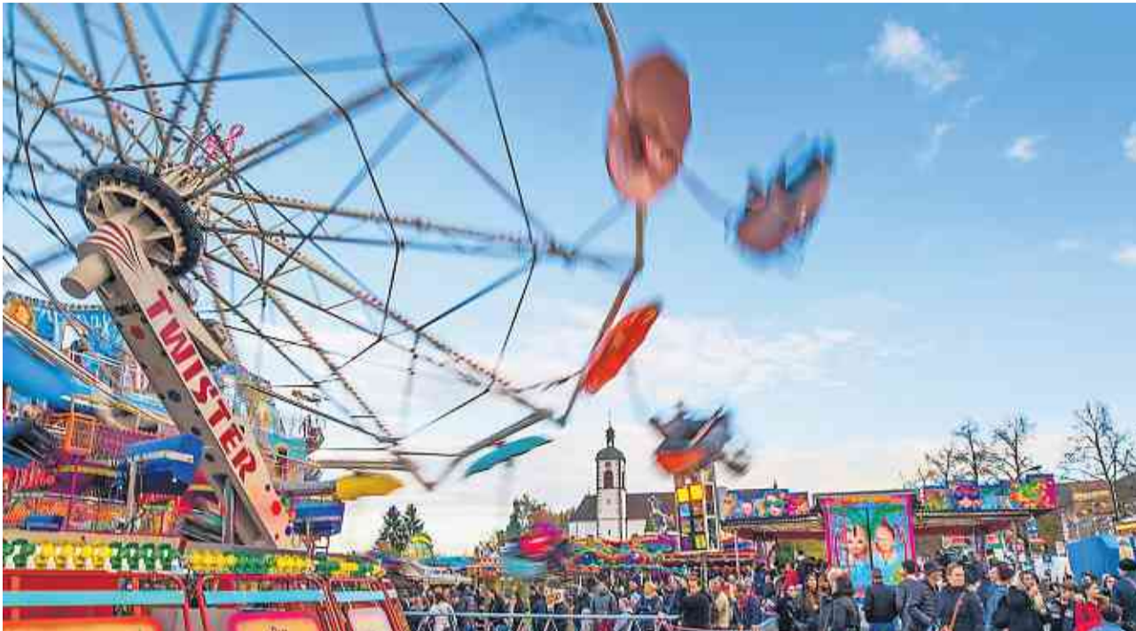
Am Montag, 31. Oktober ist wieder Kreuzlinger Jahrmarkt.