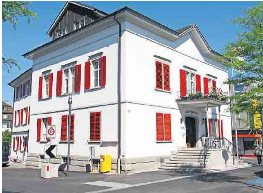
Der Stadtrat genehmigte das Projekthandbuch zur Sanierung und Erweiterung der Verwaltungsliegenschaften.

Mit der Bauherrenvertretung für die Sanierung und Erweiterung der städtischen Verwaltungsliegenschaften beauftragte der Stadtrat das Büro Helbling Beratung + Bauplanung AG in Zürich. Die Auftragserteilung im August erfolgte nach der öffentlichen Ausschreibung gemäss den Bestimmungen des öffentlichen Beschaffungswesens (IVÖB). Mittlerweile wurde zusammen mit dem Büro das Projekthandbuch erstellt. Dieses Arbeitsinstrument bestimmt die Aufgaben aller Projektbeteiligten in