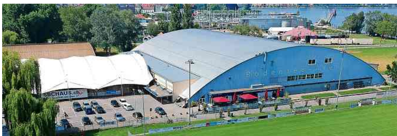
Die Bodensee-Arena verzeichnet einen kleinen Gewinn.