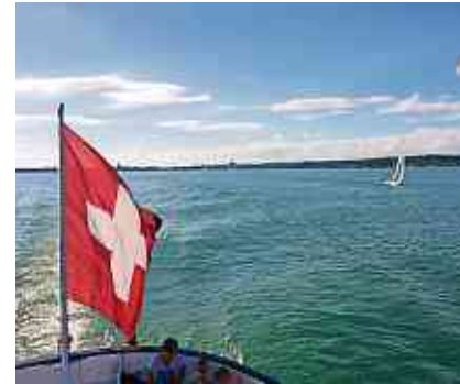
Vorfreude auf eine Kreuzfahrt auf dem See.

Die SBS-Tageskarten können bis Ende April am Informationsschalter im Stadthaus an der Hauptstrasse 62 für CHF 30.00 bezogen werden. Kartenzahlung ist möglich. IDSK