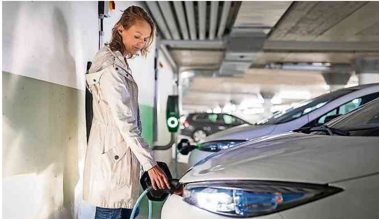
Neu wurde auch Elektromobilität ins Förderprogramm aufgenommen.

Seit 20 Jahren fördert die Stadt Kreuzlingen energieeffizientes Bauen und den Einsatz erneuerbarer Energien. Damit das Förderprogramm erfolgreich bleibt und die technischen Entwicklungen abgebildet werden können, aktualisiert der Stadtrat das Papier regelmässig. Themenschwerpunkt des Energieförderprogramms bleibt die Gebäudesanierung respektive die energieeffiziente Bauweise. Darunter fällt beispielsweise die Förderung von GEAK Plus Beratungsberichten, Gesamtgebäudesanierungen nach GEAK-Effizienzklassen, die Sanierung von Gebäuden nach Minergie-Standards oder auch Neubauten, die nach Minergie-P oder Minergie-A gebaut werden. Der Stadtrat nahm auch neue Massnahmen in das Förderprogramm auf: neu wird auch der Rückbau von alten Öltanks oder Elektrodirektheizungen gefördert. Zusätzlich wird der Einbau einer Erdsonden-Wärmepumpe mit CHF 3000.- fürs Einfamilienhaus respek-