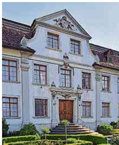
Museum Rosenegg in Kreuzlingen.

Sammeln und sortieren ist dem Menschen seit Urbeginn ein Bedürfnis: Nahrung, Baumaterial, Objekte, Kunst. Was sind die Triebfedern des Sammelns? Öffentliche kunsthistorische Aufgabe von Städten, Stiftungen und Museen, finanzielles Interesse von Kunstfonds oder persönliche Leidenschaft, Sinn für Ästhetik und der individuelle Wert des Besitzens. Sammeln ist eine Leidenschaft, eine Wertschätzung für Künstlerinnen und Künstler und ihre Werke, eine Geldanlage. Durch