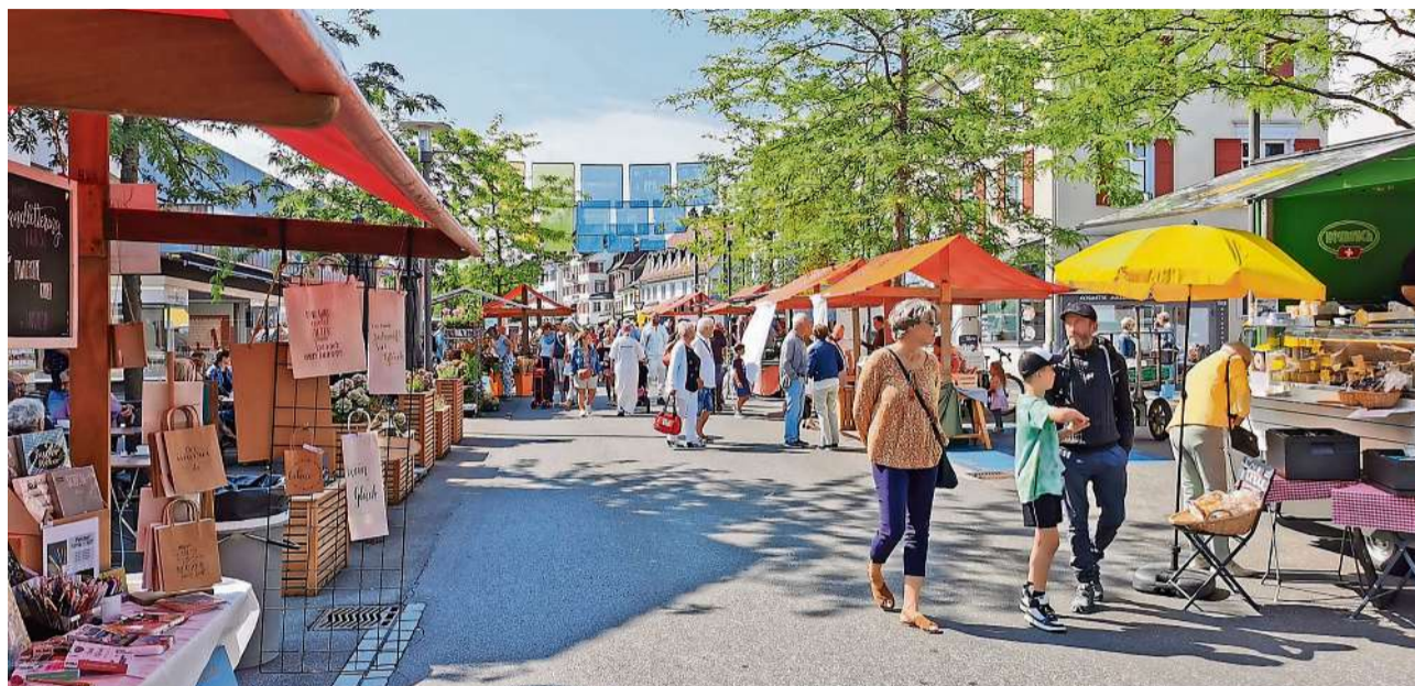
Der Chrüzlinger Markt geht in die zweite Runde.

Nach der gelungenen Premiere vom 1. Juli 2023 darf sich die Kreuzlinger Bevölkerung am 2. September auf die zweite Ausgabe des Chrüzlinger Marktes freuen. Insgesamt 36 Anbieterinnen und Anbieter sind von 8.00 bis 14.00 Uhr auf dem Boulevard präsent, die Stände laden zum Flanieren ein und bieten ein entspanntes Einkaufserlebnis. Das Angebot umfasst verschiedene Produkte direkt ab Hof und frisch vom Produzenten: Früchte und Gemüse, Fleisch, Fisch, Käse, Pasta, Öl und Saucen, Eingemachtes, Honig, Bier oder Blumen. Es ist für jeden Geschmack etwas dabei. Ausserdem haben sich wieder einige Ausstellerinnen aus dem kunsthandwerklichen Bereich angemeldet. Von Keramik über Perlen, Kosmetik, Kinderkleider, Dekoartikel, Bilder und Schmuck findet man am Markt vie-