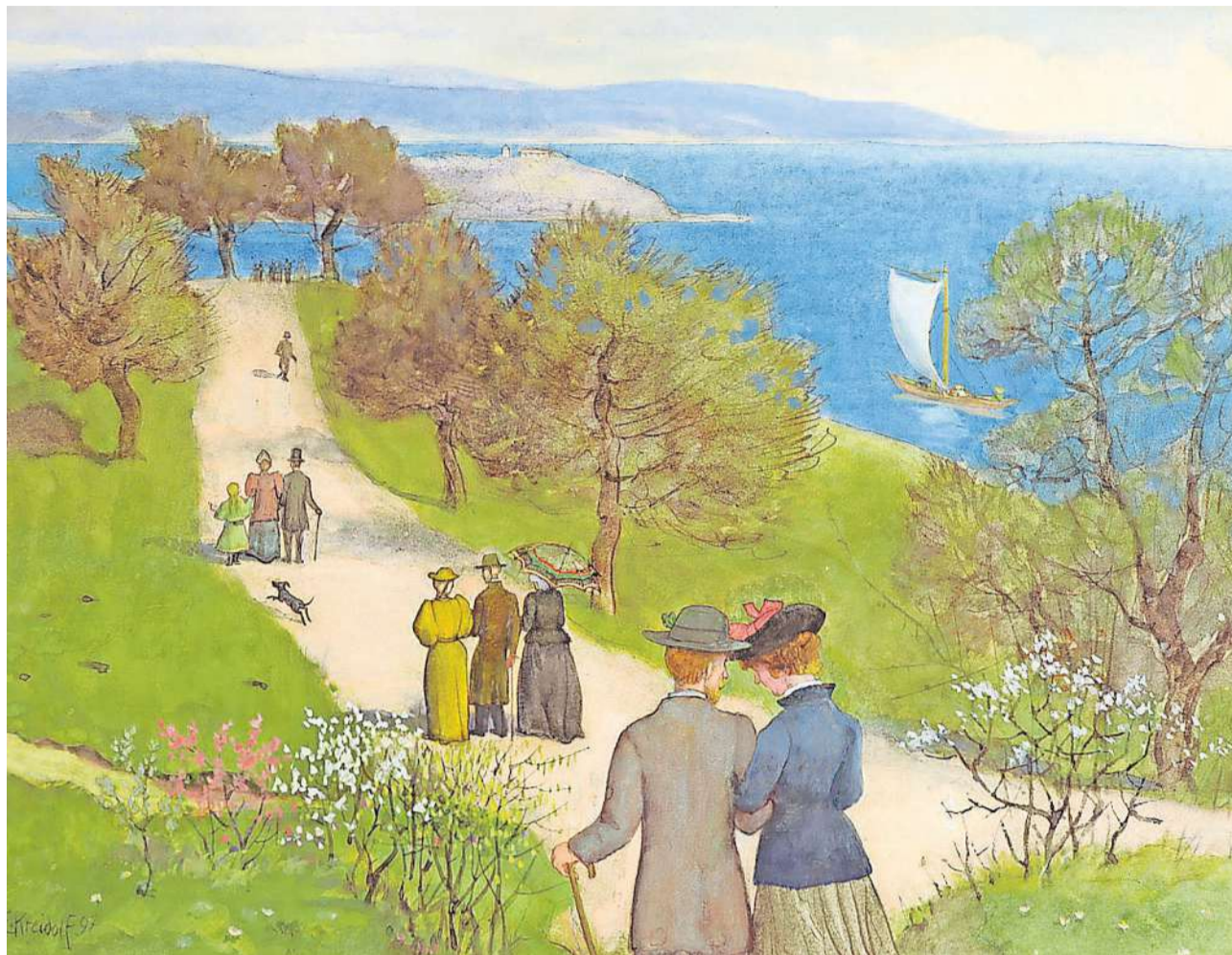
Gemälde von Ernst Kreidolf

Ernst Kreidolf (*1863 in Bern) verbrachte seine Kindheit und Jugend auf dem Bauernhof seiner Grosseltern in Tägerwilen (Staudenhof). Das ländliche Umfeld prägte den sensiblen Knaben und förderte seine Liebe zu Fauna und Flora, die sich schon früh in seinen Bildern nachvollziehen lässt. Kreidolf, der in Konstanz eine Ausbildung zum Lithografen absolvierte und in München Malerei studierte, verfügte über eine präzise Beobachtungsgabe, die er in seinen Portrait-,