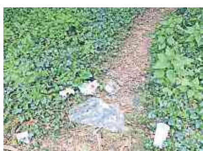
Littering in der Natur: Ressourcenverschwendung und Umweltgefahr.

Plastik, Dosen, PET-Flaschen und Verpackungen in der Natur: Das muss nicht sein. Die Naturkommission Tägerwilen organisiert am Samstag, 26. März 2022 wiederum einen Clean-up und ruft die Bevölkerung auf mitzuhelfen.