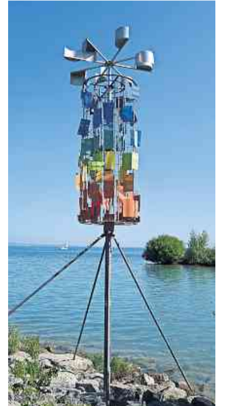
Auf Wunsch der Künstlerin wird der Freiheitsbaum im Juni abgebaut.