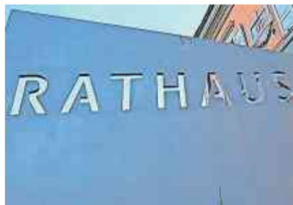
Die Veranstaltung findet im Rathaus Kreuzlingen an der Löwenstrasse 7 statt.

Das Gebiet zwischen der Bleichstrasse sowie Romanshonerstrasse und dem Kirchweg in Kurzdickenbach untersteht der Gestaltungsplanpflicht. Der rechtskräftige Gestaltungsplan «Chogenbach» aus dem Jahr 1982 und die Baulinien aus den Jahren 1939 und 1957 entspre-