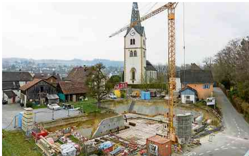
Baufortschritt zum Neubau des Kirchgemeindehauses.

Die Firma Wanzenried startete mit den Baumeisterarbeiten am 20. Februar und kommt gut voran. Die Bodenplatte wurde in vier Etappen vorbereitet und erstellt und jetzt kann man mitverfolgen wie die Wände in mehreren Phasen das Untergeschoss in die geplante Form bringen. Der östliche Bereich bildet einen Hauptteil der späteren Jugendräume und wird überdeckt. Nur die Fensterfront mit den vorgelagerten Parkplätzen gegen Norden (Pflanzbergstrasse) lässt das Untergeschoss sichtbar werden. Machen Sie doch hie und da einen Spaziergang und verfolgen Sie den Baufort-