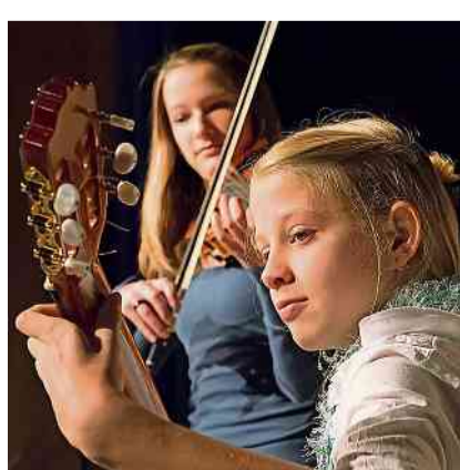
Ab Sommer 2024 werden auch im Kanton Thurgau Musiktalente gefördert.

Ab Sommer 2024 werden auch im Kanton Thurgau Musiktalente von 4 bis 25 Jahre gemäss dem neuen Bundeskonzept «Junge Talente Musik» gefördert. Das Bundesamt für Kultur legte im letzten Jahr Standards fest und wies die Kantone an, Institutionen als Leistungserbringer anzuerkennen.