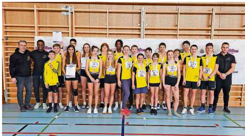
Stolze Trainer umrahmen die erfolgreichen Teams der U14 und U16.

Die U16 Teilnehmenden der LAR glänzten mit einem kompletten Medaillensatz. In der Kategorie U16 Boys holte Tägerwilten-Kreuzlingen Gold, bei den U16 Girls Silber und Bronze sicherte sich das zweite Team der U16 Boys. Das U14 mixed Team grüsste ebenfalls zuoberst vom Stockerl und präsenierte stolz ihre goldene Auszeichnung. Die U12 mixed rundete die Superleistung ab und gewann die Bronzemedaille. Somit sind alle Teams für den Regionalfinal Mitte Februar in Frauenfeld qualifiziert und streben die Qua-