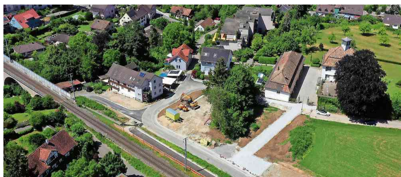
Das Viadukt Sauloch aus der Vogelperspektive: Die Bauarbeiten sind Ende April abgeschlossen. IDSK