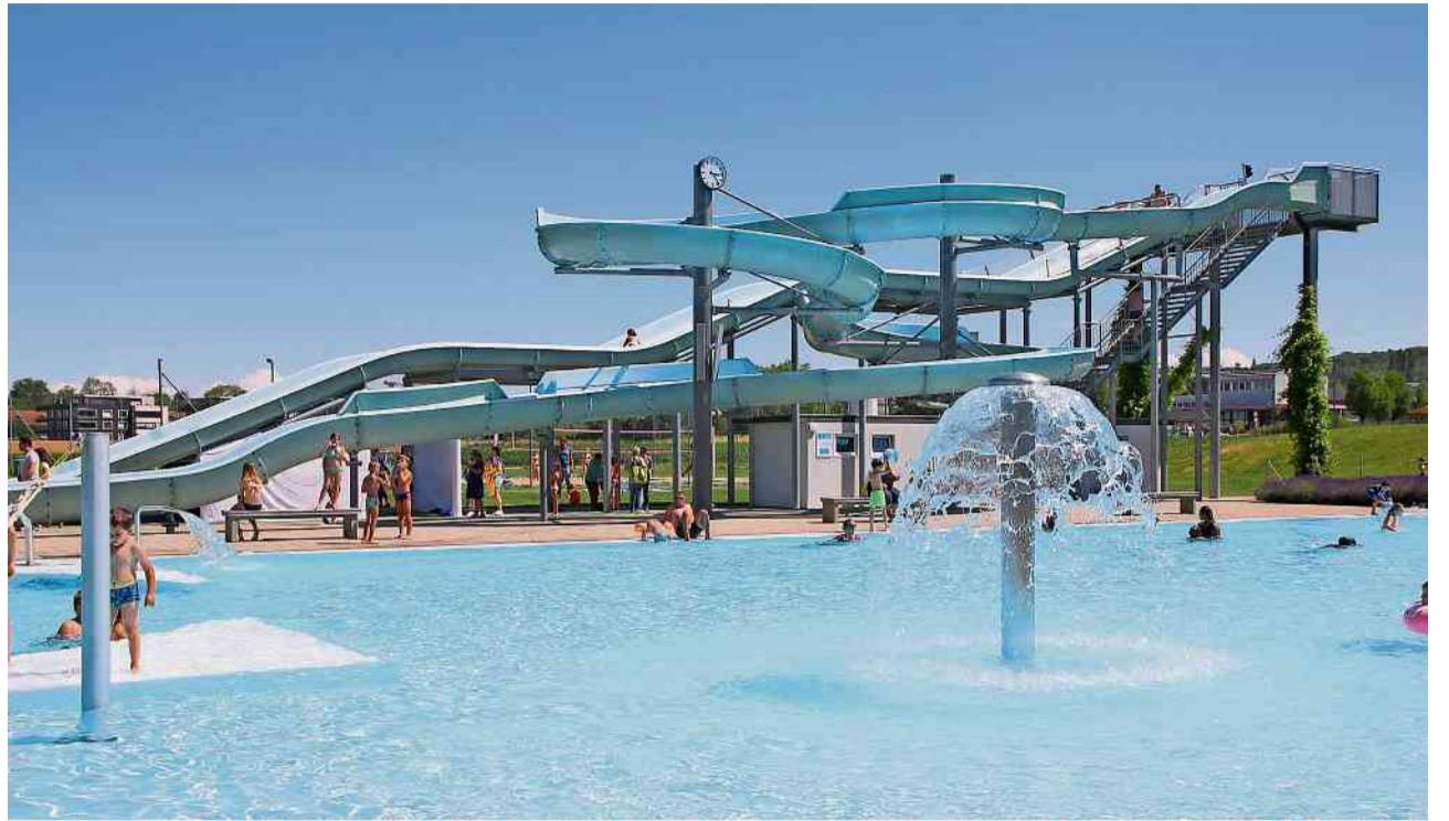
Die Stadt übernimmt die Betriebsführung des Schwimmbads Hörnli.

Mit der Übernahme der Betriebsführungen des Schwimmbads Hörnli und des Bads Egelsee im Juli 2023