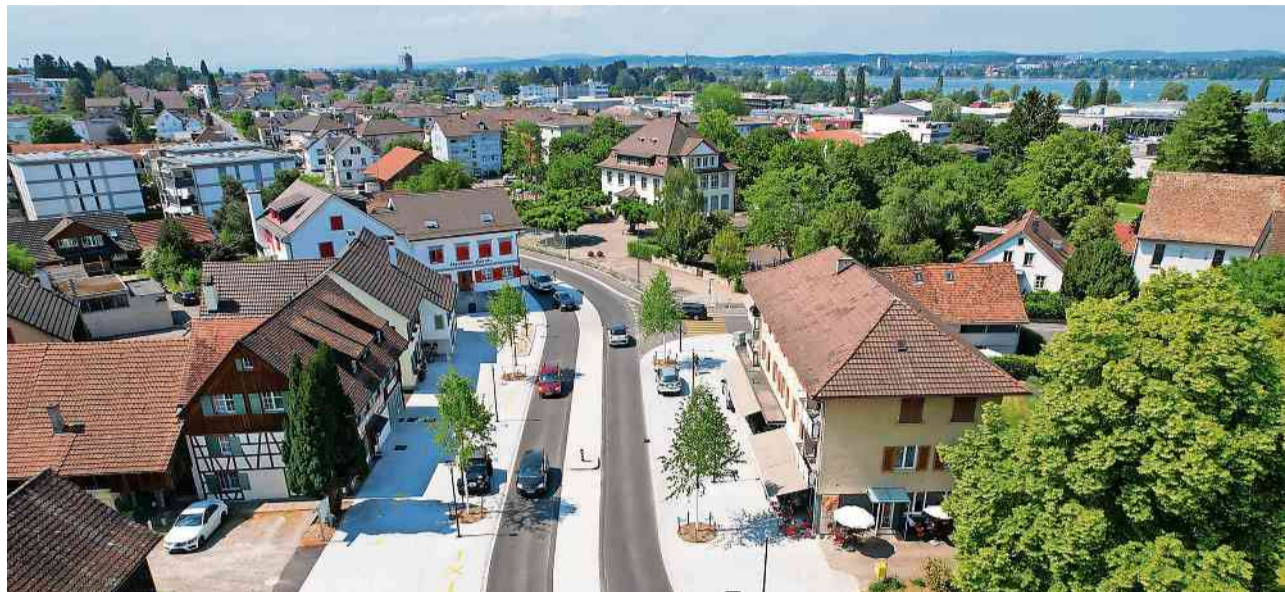
Nach umfangreichen Abklärungen sieht der Stadtrat von einem Fussgängerstreifen im sanierten Dorfzentrum Kurzrickenbach ab.

Nach der umfassenden Güterabwägung, für die auch ein Variantenvergleich zur Platzierung eines Fussgängerstreifens erstellt wurde, sieht der Stadtrat von einem zusätzlichen