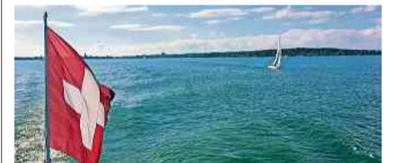
Die Saison startet am 29. März.

Die Tageskarte der Schweizerischen Bodensee Schifffahrt gilt während eines ganzen Tages auf allen SBS-Kursschiffen auf dem Bodensee und ist während der Saison ab 29. März bis Mitte Oktober 2024 gültig, ausgenommen auf der Fähre Romanshorn-Friedrichshafen und auf den kulinarischen Themenfahrten. Alle Kursschiffe verfügen über eine Bordgastronomie. Die SBS-Tageskarten können am Informationsschalter im Stadthaus an der Hauptstrasse 62 bezogen werden.