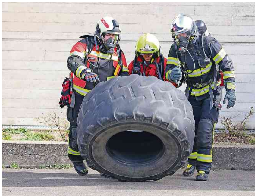
Ab 2025 erhalten alle angehenden Feuerwehrleute eine intensive Schulung.

Die Grundausbildung für angehende Feuerwehrleute wird im Kanton Thurgau neu organisiert. Die Gebäudeversicherung Thurgau (GVTG) und der Feuerwehrverband Thurgau (FVT) haben gemeinsam das Konzept erarbeitet. Vier Stützpunkfeuerwehren sind Austragungsorte der dreitägigen Pilotkurse. Ab 2025 wird die Ausbildung für alle Feuerwehren im Kanton angeboten. Leitungsbau, Hohlstrahlrohr, Leiterdienst, Rettungen, Motorspritze ab Hydranten, Atemschutz, Grundausbildung Tanklöschfahrzeug – die Liste der Themenschwerpunkte war reich bepackt und beinhaltet das grundlegende Feuerwehrhandwerk. Während drei Tagen und 22 Lektionen haben 29 Teilnehmende