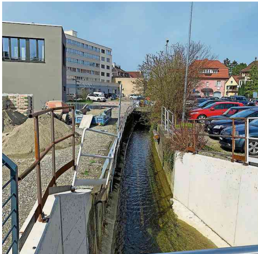
Bis zum Emmishofer Zoll wird der Schoderbach freigelegt und ökologisch aufgewertet.

Dank den Vereinbarungen konnte die Stadt ausreichend Land für den umfangreichen Abflussquerschnitt sowie für eine breite Abtreppung si-