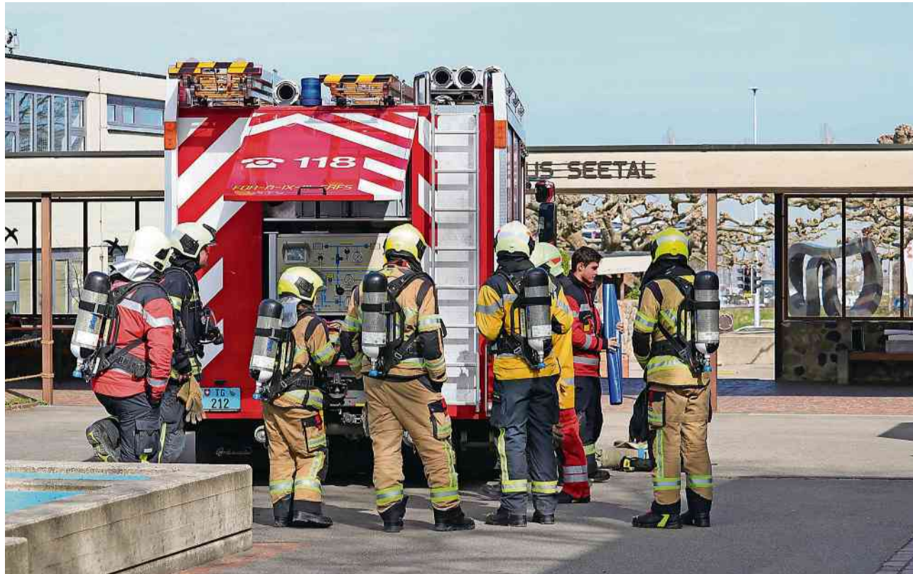
Kreuzlingen war einer der vier Austragungsorte im Kanton Thurgau.