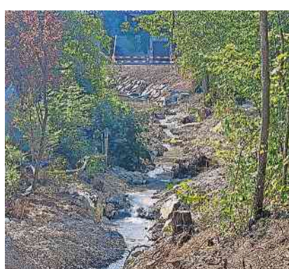
Mit neuem Gesicht: Der Allmendbach zwischen Palmenweg und Gemeindehaus. zvq

Vor und während der Sommerferien wurde am Allmendbach im Abschnitt zwischen Palmenweg und Gemeindehaus zügig gearbeitet. Durch verschiedene Massnahmen wie z.B. Entfernung des Uferverbau, Gerinneaufweitung, Entfernung von Sohlschwellen etc. wurde die Abflusskapazität gesteigert. Mittels Längsnetzwerk durch Abbau des Absturzes beim Franzosenhaus und Schaffung von ungestörten Bereichen mit neuer Bepflanzung wird der Abschnitt ökologisch aufgewertet. Für Erholungssuchende sowie die Schülerinnen und Schüler der angrenzenden Schulbauten wird durch einen Zugang zum Bach auch ein Mehrwert für die Menschen geschaffen.