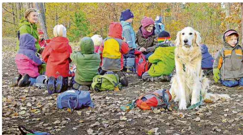
Heute Donnerstag im Kult-X: Der Dokumentarfilm «Alphabet».

Kreuzlingen In Interviews mit internationalen Bildungsforschern, einer Schülerin, einem ehemaligen Personalvorstand und nur einem Lehrer geht der Regisseur Erwin Wagenhofer der Frage nach, wie angesichts aktueller gesellschaftlicher Krisen ein adäquates Bildungssystem aussehen müsste. Ihm zufolge versagt das gegenwärtige System durch einseitige Fixierung auf Leistung und technokratische Lernziele. Den Mangel an Alternativideen zur aktuellen Bildungslandschaft führt er darauf zurück, dass die Grenzen unseres Denkens schon in der Schule zu eng gesteckt werden. Inwiefern müssen wir uns von alten Denkmustern verabschieden und stattdessen in den Kindergärten,