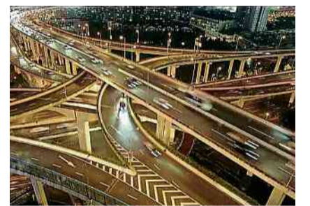
«The Human Scale» ist im Kult-X zu sehen.

Am Donnerstag, 16. Januar, 20 Uhr, zeigt das Filmforum KuK im Kult-X den Dokumentarfilm «The Human Scale» in Kooperation mit dem Museum Rosenegg zur aktuellen Ausstellung «GEPLATZTE STADTRÄUME».