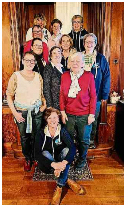
Die Neumitglieder und Jubilarinnen.

Ein Highlight des Abends war die Vorstellung des neuen Jahresprogramms, das zahlreiche spannende Anlässe bereithält. Die Mitglieder dürfen sich unter anderem auf die Abendunterhaltung im März, eine Vereinsreise nach Thun und Interlaken sowie den beliebten ‚Laternliwäg‘ im November freuen. Zudem stehen sportliche Aktivitäten wie eine Fahrradtour und ein gemeinsamer Turnabend mit dem MTV auf dem Programm.