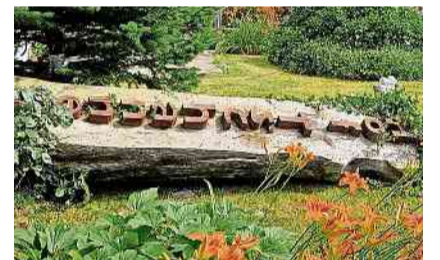
Der Hof-Tschannen: am Boden, aber nicht zerstört.

Die Schweiz hat viele Gesetze, wie viele genau, ist schwer zu sagen. Der Sinn eines Gesetzes besteht darin, Ordnung, Sicher- heit und Gerechtigkeit in einer Gesellschaft zu gewährleisten. Innovation und Gesetzgebung stehen dabei manchmal in einem herausfordernden Ver- hältnis zueinander.