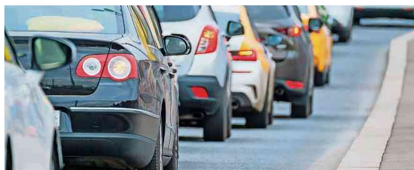
Die am stärksten befahrenen Kantonsstrassen sind in Kreuzlingen und Bottighofen.

Die zwei am stärksten befahrenen Kantonsstrassen im Jahr 2025 sind in Kreuzlingen die Romanshornstrasse zwischen Ziil und Bottighofen mit einem durchschnittlichen täglichen Verkehr (DTV) von rund 23'000 (+1.8 % gegenüber 2024) und in Bottighofen die Hauptstrasse zwischen dem Mühlegässli und Kreuzlingen mit rund 19'600 (+1.1 % gegenüber 2024). Die Verkehrsstatistik gibt auch Auskunft über den Veloverkehr. Die zwei Messstellen in Arbon und Bottighofen befinden sich entlang des touristisch beliebten Bodensee-Radwegs. Bei beiden Zählstellen konnte im Mehrjahresvergleich eine Zunahme (Arbon +6.1 % und in Bottighofen +5.6 %) verzeichnet werden, was auf das im Vergleich zum Vorjahr bessere Wetter zurückzuführen ist. ID