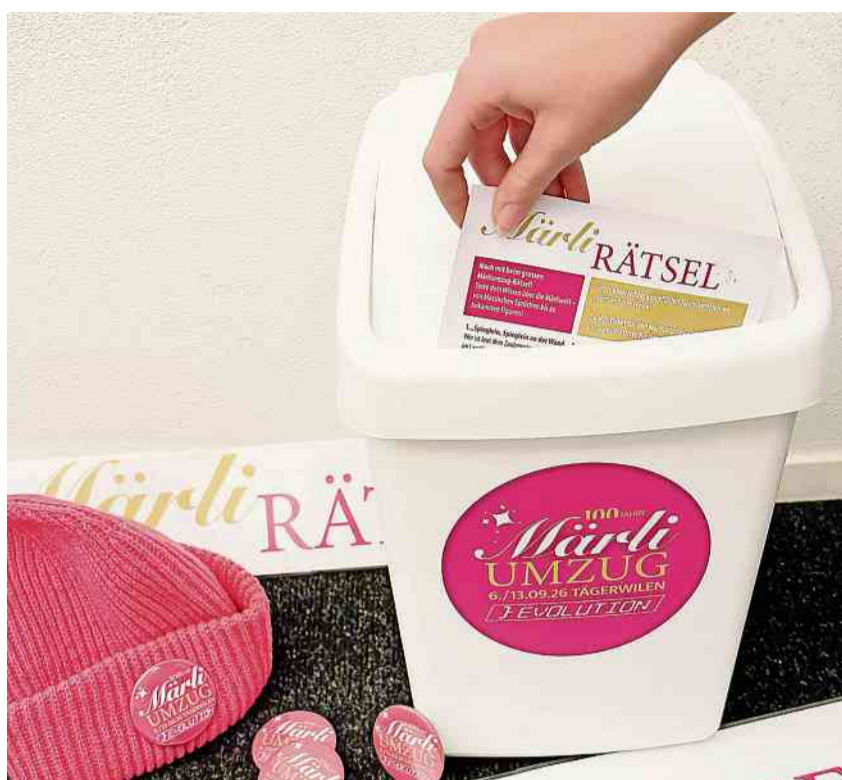
Ziehung der 10 Gewinner.