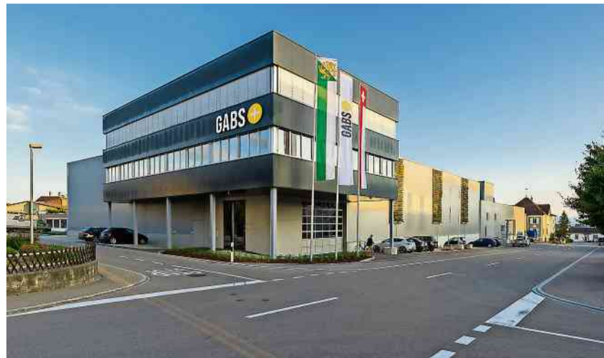
Bei der Gabs AG findet ein Tag der offenen Tür statt.

Besucherinnen und Besucher können in entspannter Atmosphäre Handwerkzeuge und Spenglermaterial zu unglaublich günstigen Preisen entdecken – ideal für Profis, Hobbyhandwerker und alle, die sparen möchten. Beim Event stehen nicht nur attraktive Angebote im Mittelpunkt. Die Gabs AG bietet zudem Firmenrundgänge an, bei denen Sie einen seltenen Blick hinter die Kulissen des Unternehmens werfen können. Erfahren Sie, wie aus hochwertigen Materialien passgenaue Lösungen für Fassaden, Dächer und Spengler-Projekte werden. Natürlich ist auch für das leibliche Wohl gesorgt: Ein Grillstand sorgt für Essen und Trinken, damit Klein und Gross gestärkt durch die Hallen