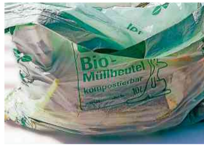
Diese Abfallbeutel gehören nicht in die Grüntonne.

Biologisch abbaubare Kunststoffe können, müssen aber nicht «biobasiert» – also aus nachwachsenden Rohstoffen wie Mais oder Stärke – hergestellt sein. Denn es gibt auch erdölbasierte Kunststoffe, die unter bestimmten Bedingungen durch Mikroorganismen zersetzt werden können. Selbst wenn in der Beschreibung von Kunststofftüten «biologisch abbaubar» steht, braucht der Kunststoff in der Natur mitunter Monate oder Jahre, um sich zu zersetzen. Auch in der Kompostieranlage dauert der Zersetzungsprozess je nach Verfahren zu lange. Zusätzlich hinzu kommt die Belastung mit teilweise toxischen Schadstoffen, die