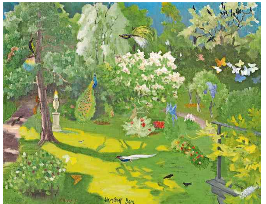
Ernst Kreidolf «Der Zaubergarten».