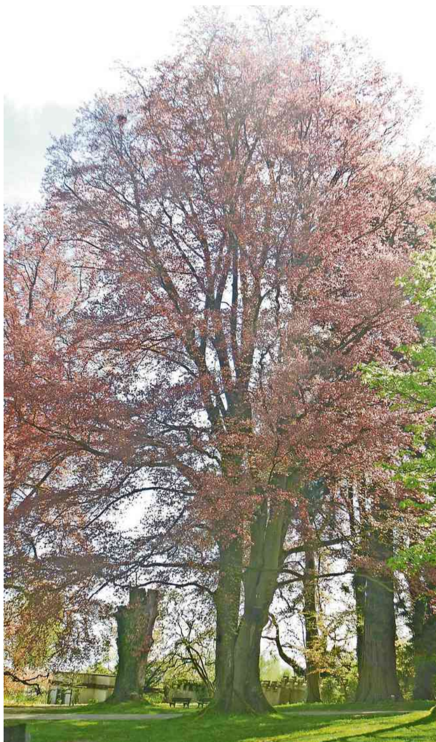
Die kranke Blutbuche muss gefällt werden.