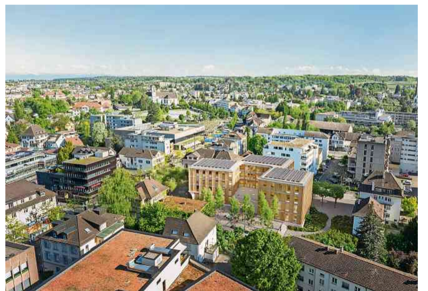
Das geplante Stadthaus aus der Vogelperspektive.